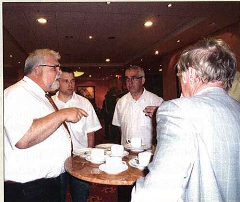
Diskussion über Erfahrungen von ORBIS-Anwendern